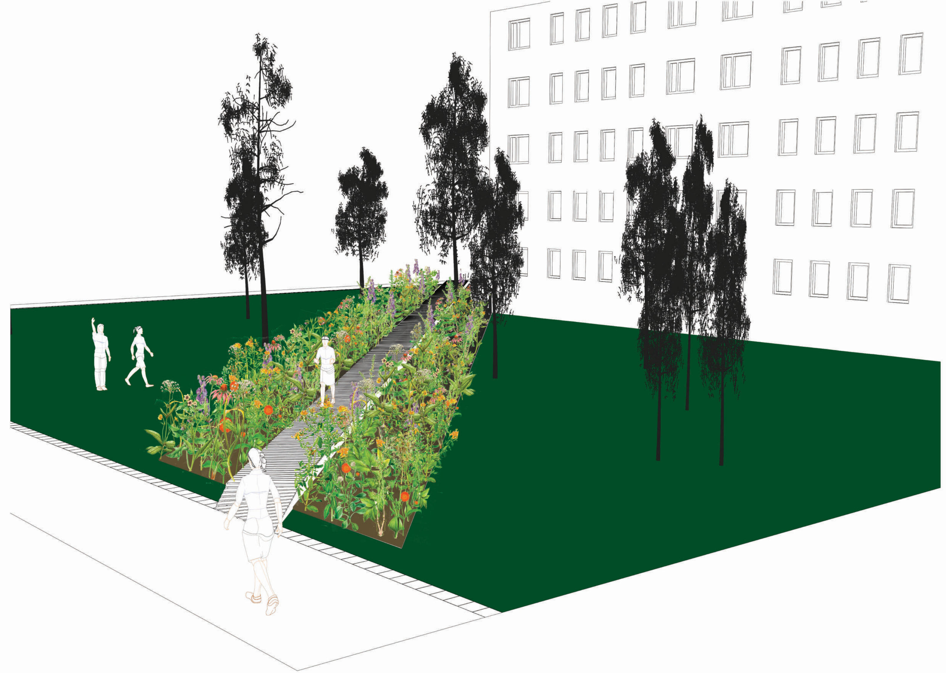
Zwei Nutzungen des STEGs: Passage und Naturerlebnis - Blick aus Richtung Mollstraße, die Wildblumen entlang des Laufsteges bilden im Sommer Blühstreifen von bis zu 1,5 m Höhe