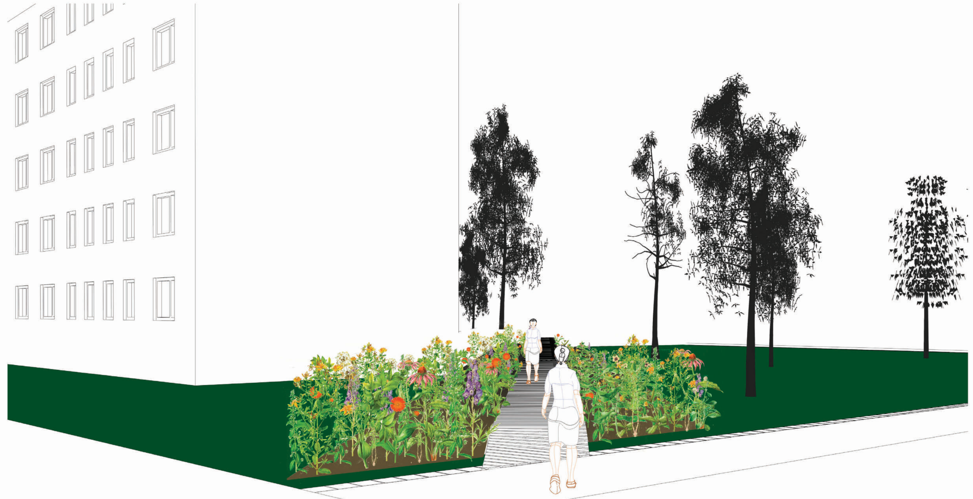
Blick in den Wildblumenkorridor: Gegenverkehr von Passanten am Zugang Berolinastrasse